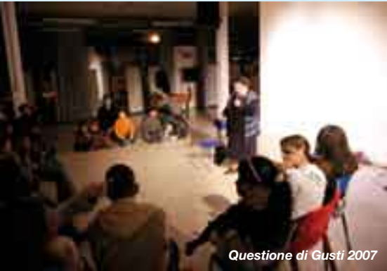
Questione di Gusti 2007

2001, gli interventi del Comune di Reggio Emilia – tutti cofinanziati dalla Regione – nelle zone della città considerate a rischio. Lo scopo: rivitalizzare le zone intorno alla stazione e sviluppare relazioni positive fra i cittadini residenti.