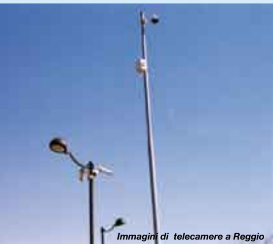
Immagini di telecamere a Reggio

verde; acquistato e ristrutturato l'immobile in via Turri 49, destinato a sede del Centro d'Incontro Reggio Est. Gli interventi hanno interessato le zone di via Cassala/Gondar, via Bligny/Agosti, viale Ramazzini/via Veneri, via Eritrea/Don Alai/Monsignor Tondelli, via Vecchi, via Turri, via Sani, via Paradisi e i parchi di Villa Cougnet e di via Paradisi.