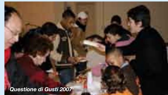
Questione di Gusti 2007

Gli educatori, insieme alle mediatrici culturali del Centro per le famiglie, incontrano con regolarità i genitori dei ra-