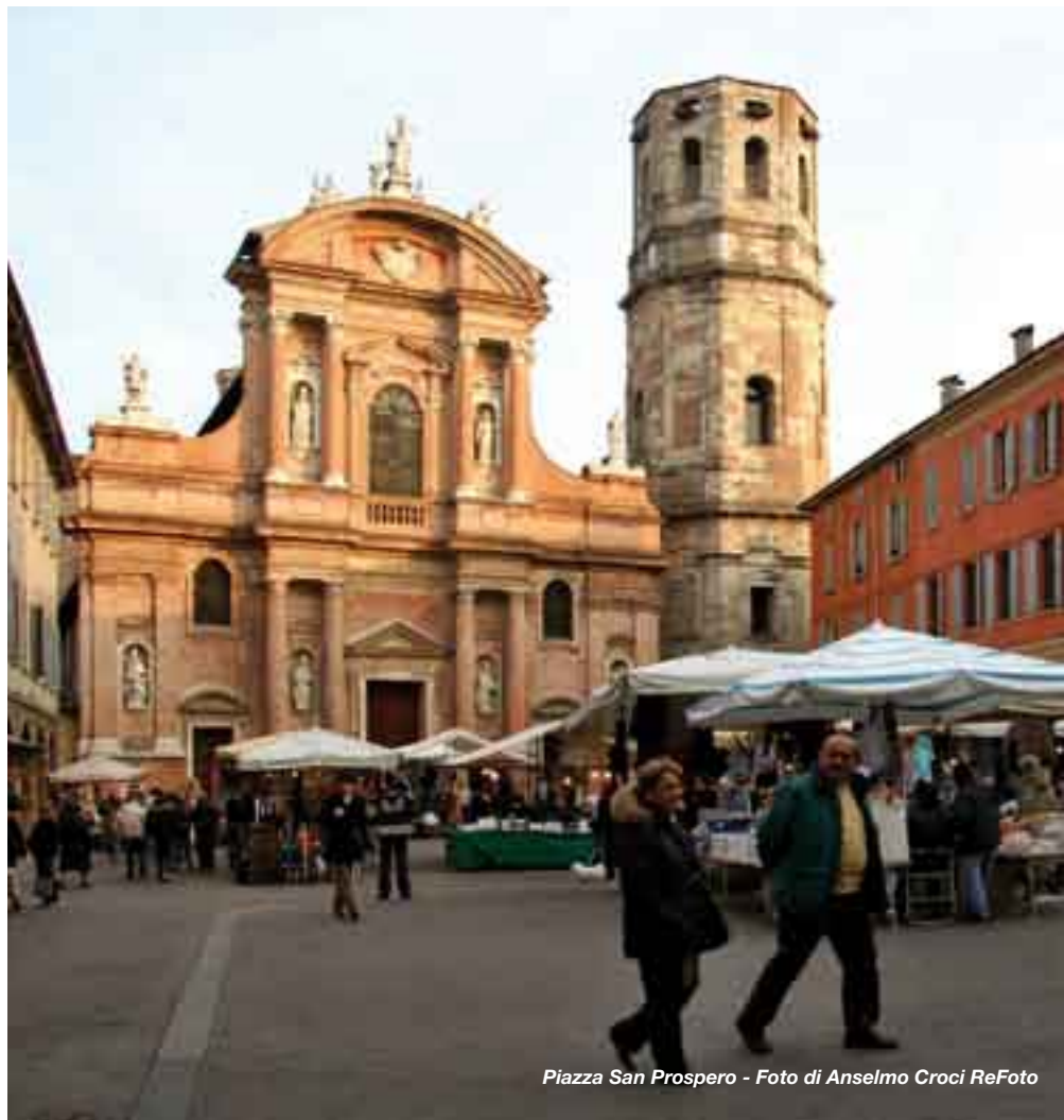
Piazza San Prospero

Nonostante la carenza d'organico dovuto ai pensionamenti, nel 2006 la Polizia municipale - oltre al lavoro di prevenzione e sicurezza svolto in tutte le zone della città - ha risposto a quasi 8.400 richieste d'intervento. Sono