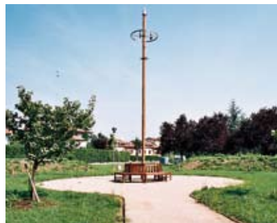
Nelle immagini il parco del Diamante e il giardino dell'Arca con il pennone e le campane a vento

Sono così chiamate perché è il vento a farle suonare. Il loro batacchio è legato a un largo timone, che cattura i più piccoli refoli di vento. Il timone porta inciso formule e testi poetici; diventa così, simbolicamente, veicolo della magia racchiusa nel suono delle parole che il vento può liberare. Un percorso ciclopedonale collega l'area circolare e "solare" delle religioni, alla zona opposta del giardino, costituita da un'antica cisterna, ora usata come piccolo palcoscenico all'aperto, il cui fondale semicircolare "lunare" è stato dipinto dai writers di Unità di strada. Nel mezzo un grande roseto a forma di cuore. Vasca, pista con roseto e giardino delle religioni costituiscono un geoglifo, visibile solo a grande altezza, che scrive la parola "amo". Segni, profumi, colori, suoni e simbolismi che vogliono testimoniare una speranza, un progetto di solidarietà centrato sull'uomo, sul rispetto e sull'amore. ■