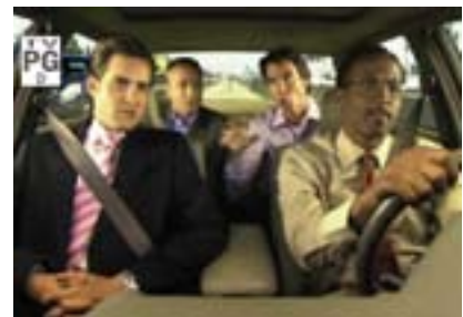
I protagonisti americani della serie Tv “Carpoolers” ispirata al car pooling

curezza nelle strade; riduce i tempi di trasporto privato e migliora l'efficienza del trasporto pubblico.