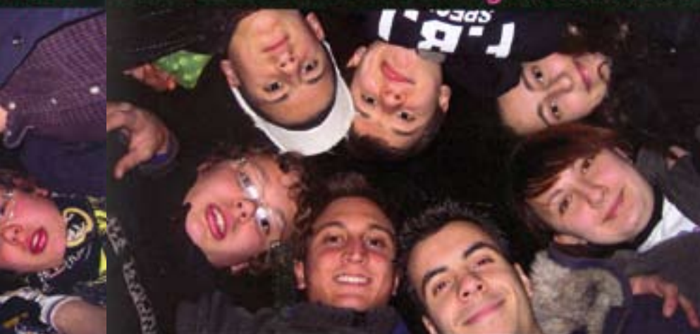
Le immagini della campagna contro la violenza alle donne pensate dai ragazzi del progetto Lampada di Aladino, con l'associazione Nondasola

...ne! Noi diciamo NO alla violenza sulle donne!