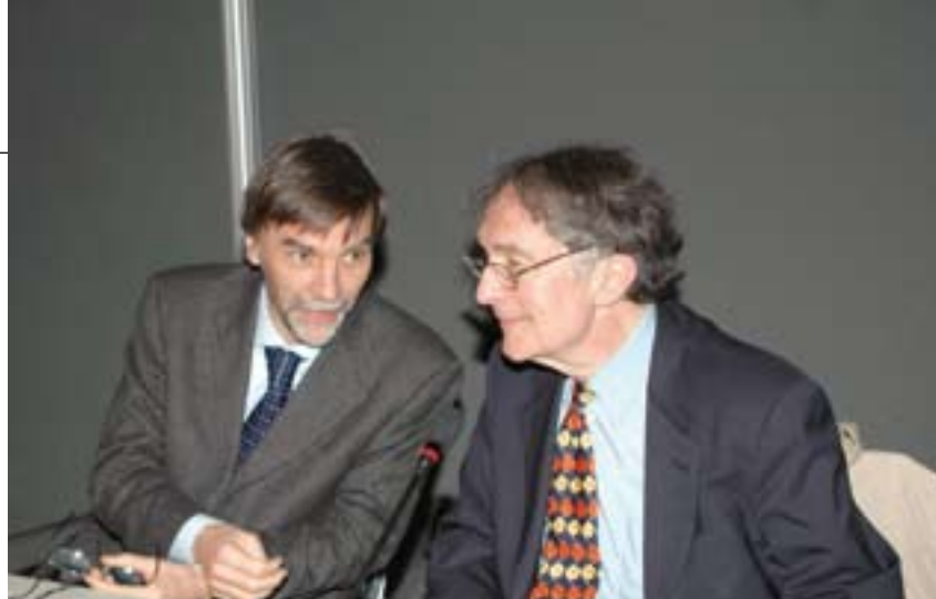
Howard Gardner con il sindaco Delrio A fianco, in visita all’atelier Raggio di Luce

“Il mio esempio preferito di una comunità etica è una piccola città di nome Reggio Emilia nel nord Italia. Oltre a provvedere a servizi di alta qualità e benefici culturali per i propri cittadini, la città provvede ad eccellenti centri per l’infanzia e prescolari. I bambini sentono che la comunità si prende cura di loro. Così, quando crescono, restituiscono questo riguardo prendendosi cura degli altri. Diventano buoni lavoratori e buoni cittadini”.