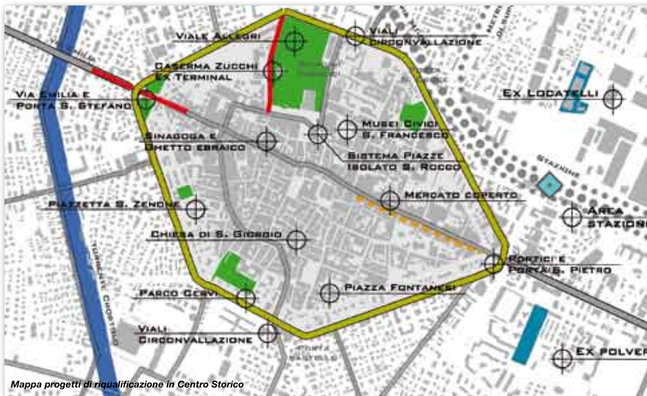
Mapa progetti di riqualificazione in Centro Storico

e il recupero dei viali urbani che partono dal centro storico, viale Umberto, via Regina Elena, via Morandi, la via Emilia storica e oltre le porte della città. Sarà l'anno dell'area Nord della città e l'ambientazione delle opere di Calatrava, del project financing per il Mercato coperto e del progetto di riqualificazione dell'area Officine Reggiane.