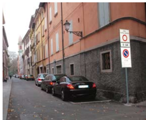
Il parcheggio all'ex Caserma Zucchi In alto, via San Zenone

Andranno a potenziare il sistema della sosta anche i 300 nuovi posti auto che, entro la fine di novembre, saranno realizzati nel piazzale dell'ex Zucchi, che verrà