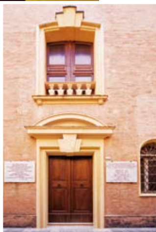
A sinistra momenti dell'inaugurazione con Delrio e Prodi; la splendida cupola con particolare del solaio e facciata esterna