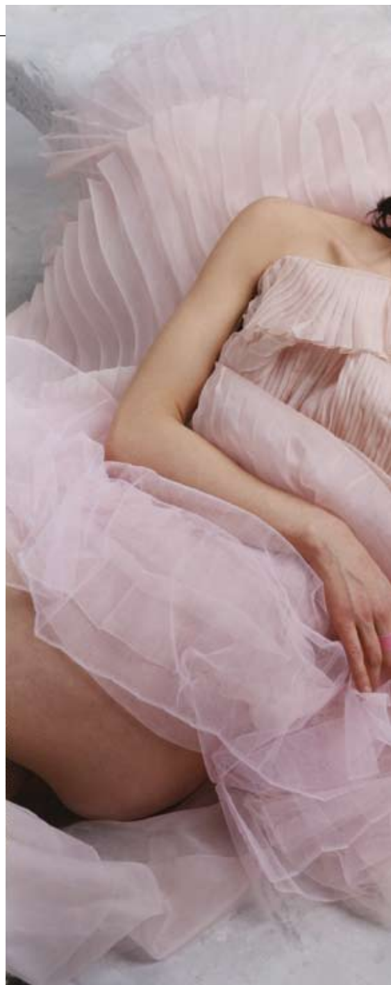
Sopra: Asia Argento, étude, juin 2005, Paris Courtesy Galerie Jerome de Noirmont, Paris di Bettina Rheims e a sinistra © Jorge Molder, della serie "Nox", 1999, Courtesy Museu Coleção Berardo, Lisboa

Accanto alle commissioni, Fotografia Europea propone poi cinque mostre dedicate ad autori europei di cinque pe-