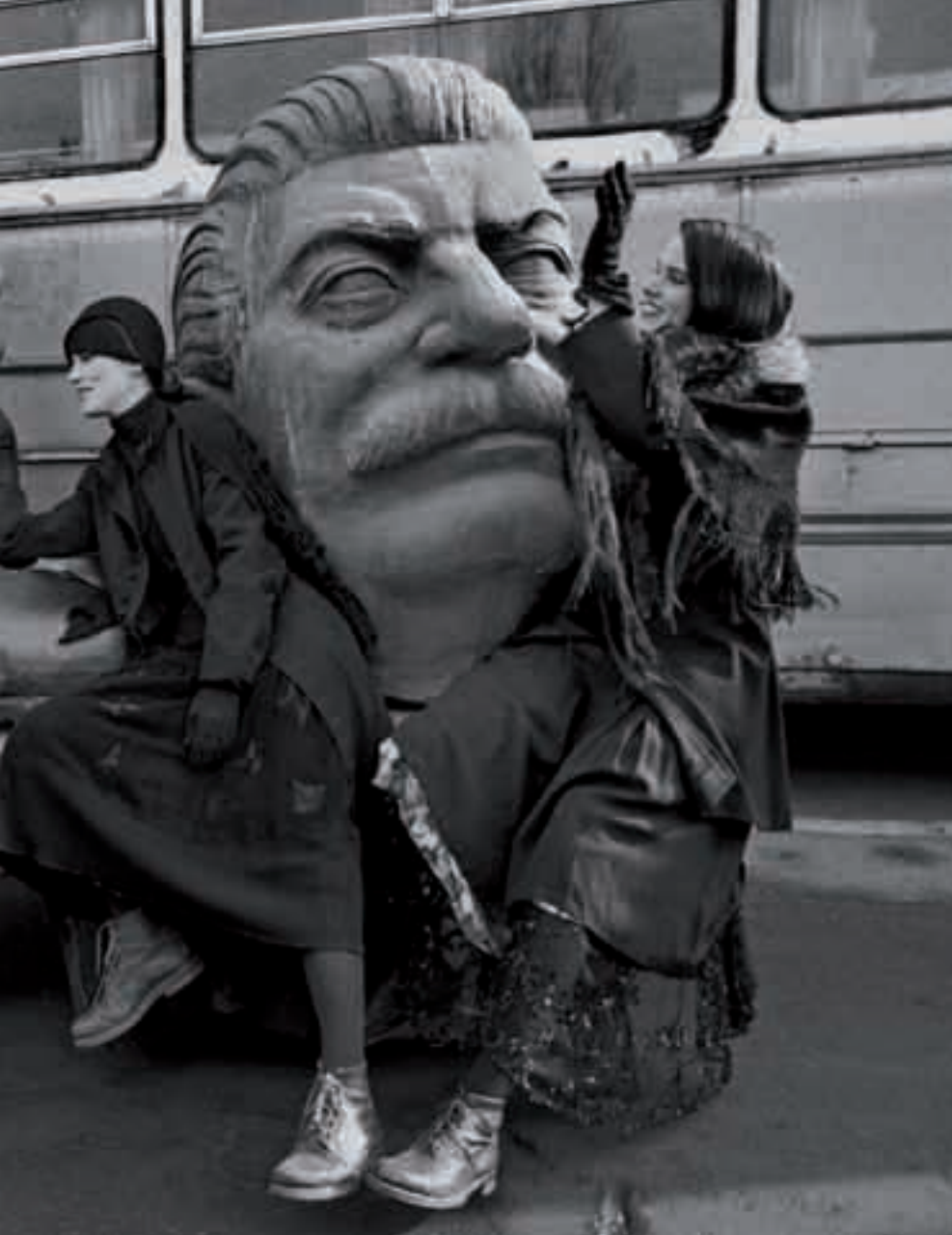
In alto a sinistra foto di Luigi Ghirri, Amsterdam 1980-81, Polaroid; al centro Ferdinando Scianna – Budapest, Ungheria 1990; sotto Pietro Iori – Amsterdam, Vite in vetrina, 2007