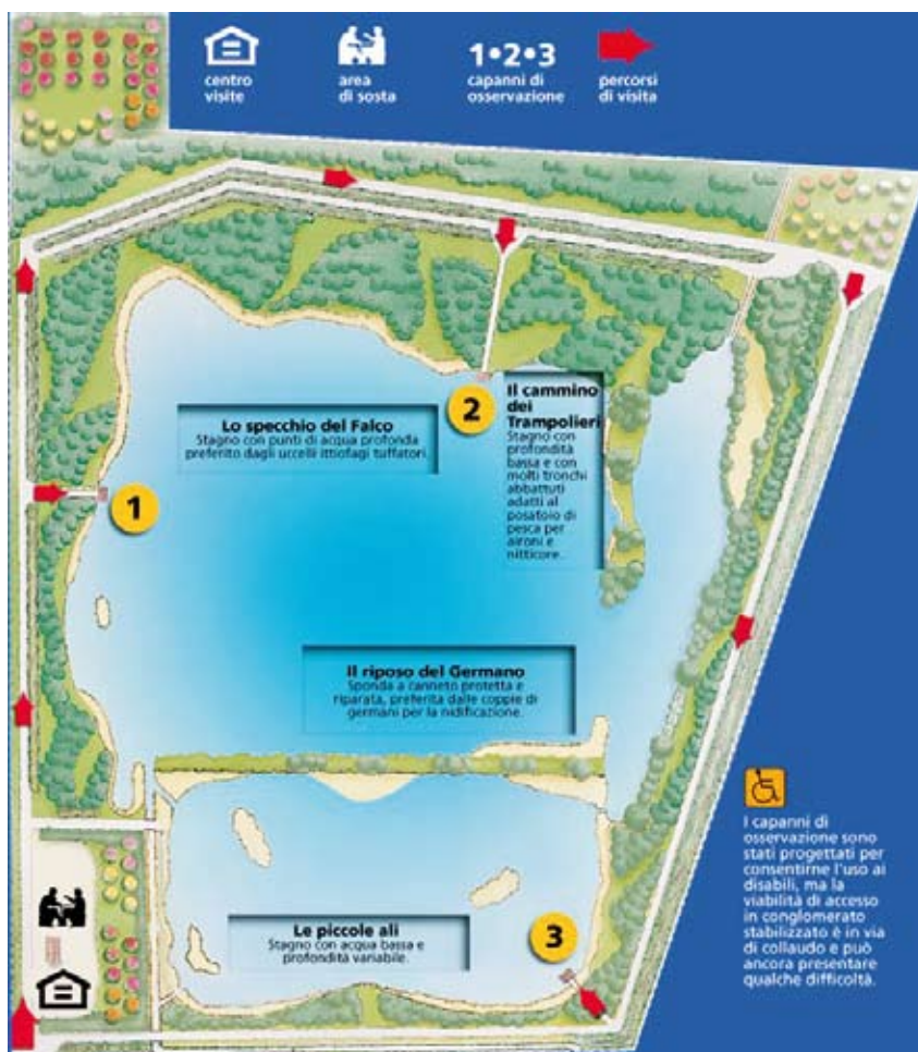
A fianco la mappa dell'Oasi di Marmirolo In alto una gallinella d'acqua e una starna

Tel e Fax: 0522/957291 E-mail: reggio-emilia@wwf.it ■