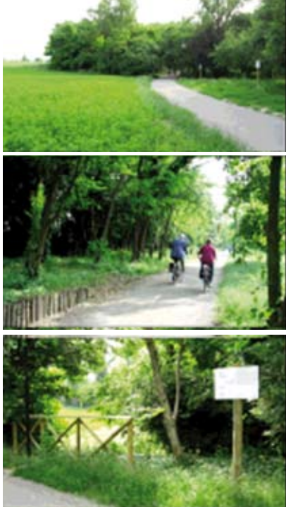
Il progetto di pianificazione del parco del Crostolo

piantumazione di duemila alberi, che incrementeranno il patrimonio dei viali dagli attuali 988 a circa 3000. In particolare